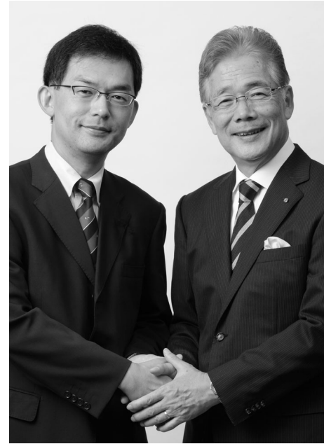
平松市長、中央区・大阪市民のためガンバレ!